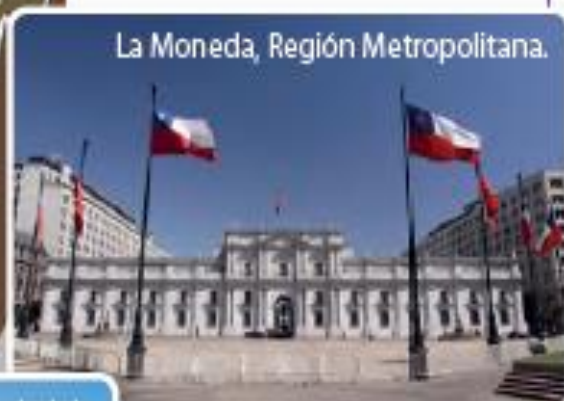
La Moneda, Región Metropolitana.