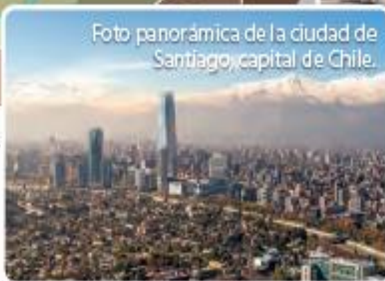
Foto panorámica de la ciudad de Santiago, capital de Chile.

Existen grandes ciudades donde vive gran parte de la población de Chile. Por ejemplo: Santiago, Valparaíso y Concepción.