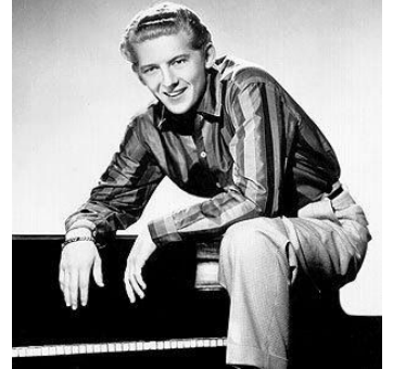
Jerry Lee Lewis