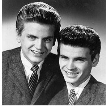
The Everly Brothers